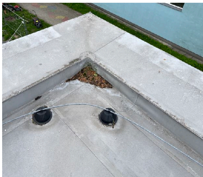
Fotodokumentace z provedené sondy